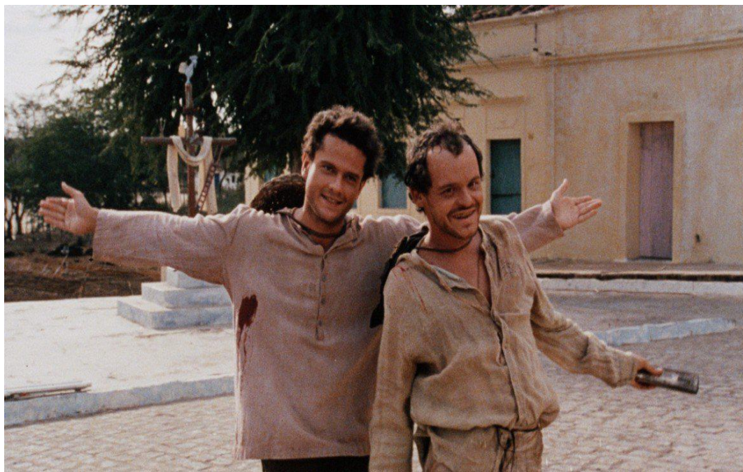
Figura 1 - Chicó e João Grilo em cena de O auto da compadecida