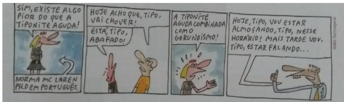
Figura 2: Tira de Adão Iturrusgarai

Segundo Cereja e Magalhães (2015a, p. 40), “dada a importância da norma-padrão, a escola se propõe ensiná-la a todas as crianças e jovens do país, preparando-os para ingressar na vida social”. Talvez a escola precise ensinar o padrão para que os estudantes, tendo acesso a ele, tenham as mesmas condições linguísticas que outros falantes vindos de outros contextos socioculturais em uma entrevista de emprego, por exemplo. Então, essa “vida social” a que se referem os autores do LD é uma vida bem restrita, atendendo a contextos específicos, como entrevistas, falas oficiais em público, momentos de maior formalidade. Afinal, todos os falantes possuem “vida social” e só se comunicam por meio da linguagem, justamente por terem vida social. Ressalta-se, assim, que os autores deveriam ter reformulado o trecho que diz que a partir do padrão os alunos são preparados para a vida social, especificando a que vida eles estão se referindo, porque com os amigos, com a família, com o (a) namorado (a) não é necessário o uso da norma padrão. Além de todas essas questões aventadas até o momento, faz-se necessário tratar de outra, que se refere à atividade da página 45 do LD, na qual se problematizam vícios de linguagem, o “gerundismo” e a “tiponite”, como é possível perceber na tira abaixo: