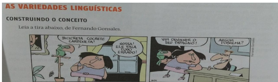
Figura 1: Tira de Fernando Gonsales

Fonte: Cereja e Magalhães (2015a, p. 39).