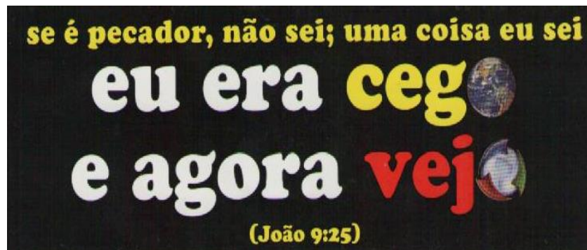
Figura 1 - Enunciado verbo-visual da Record/IURD

de uma afirmação da igreja, como vemos na imagem abaixo, publicada em 2009 em outdoors e adesivos por todo Brasil: