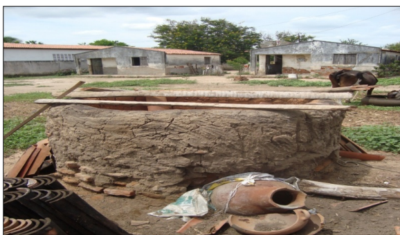
Figura 6. Local de queima de louça.

Podemos averiguar na figura/foto, a seguir, o local da queima das peças feitas durante as atividades dos estágios anteriores que mencionamos: