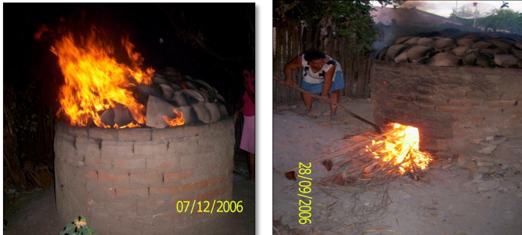
Figura 7. Queima de louça.