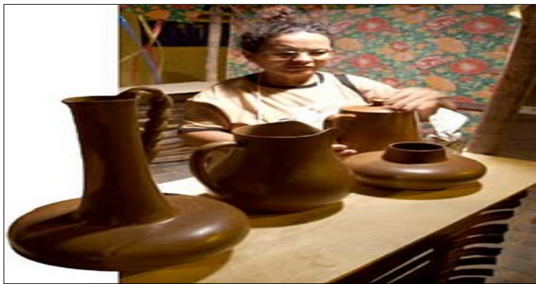
Figura 8. Finalização das peças.

Mendes (2010) relata com requintes esse estágio que classificamos como muito trabalhoso e que exige muita atenção é tanto que muitas vezes a ajuda dos maridos e parentes com força braçal é necessária para terminar essa proeza.