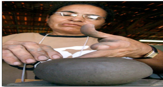
Figura 5. Processo de produção da louça.