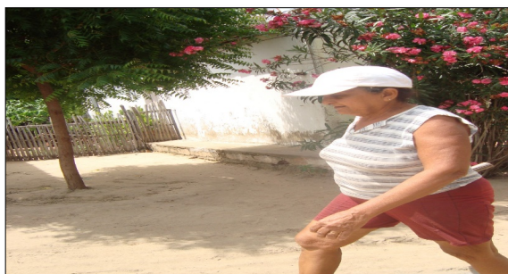
Figura 01: Imagem de louceira.

Durante esse estágio da artesanaria de produção das peças de barro pelas louceiras do Córrego de Areia, verificamos que nesse momento, a escolha da matéria-prima é de suma importância, para que as demais ações e/ou processos sejam realizadas com êxito, como podemos observar nessas figuras/fotos a seguir: