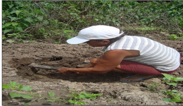
Figura 04. Louceira extraíndo matéria prima.

serão feitas a partir desse material coletado é o que mais impulsionam essas profissionais da arte de louça em continuar trilhando esse caminho.