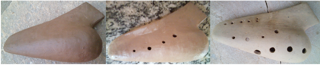
Figura 04. Ocarina dupla contralto em Sol#4.