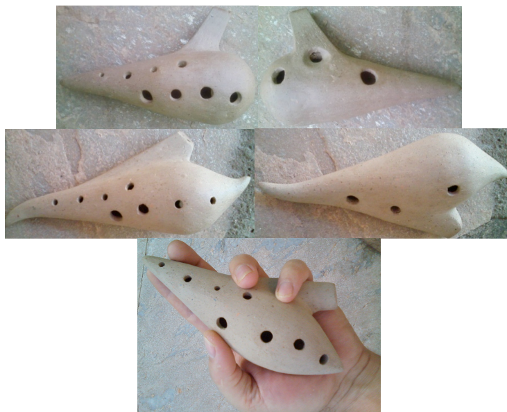
Figura 03. Protótipos funcionais: em cima, ocarina contralto em Sol \sharp ; no meio, ocarina soprano em Sol \sharp ; embaixo ocarina soprano em Lá \flat .

O problema da produção sonora da ocarina apenas em parte de seus registros estava relacionado à altura do lábio quanto à saída do canal de ar. Outro problema observado no processo referia-se às rachaduras após a perda de umidade pelo instrumento. Percebi que isso acontecia pelo fato do tudel ser produzido à parte e colado na câmara da ocarina a posteriore . O problema foi resolvido a partir do momento em que comecei a “misturar” a argila das duas partes (tudel e câmara) no procedimento de colagem.