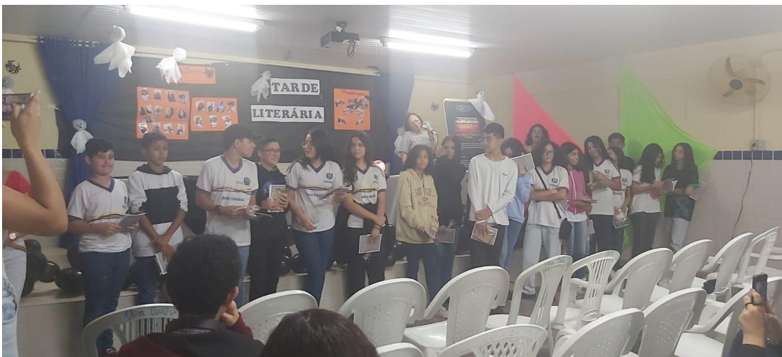
Figura 4 - Lançamento do livro “Histórias Horripilantes: coletânea de Contos de Terror”

Após a impressão dos livros e a disponibilização destes na biblioteca, realizamos o seu lançamento em um evento na escola. Abaixo segue registro desse momento tão importante para os estudantes e todos os envolvidos no projeto.