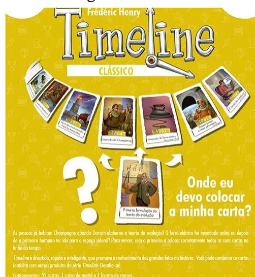
Figura 1 – Timeline