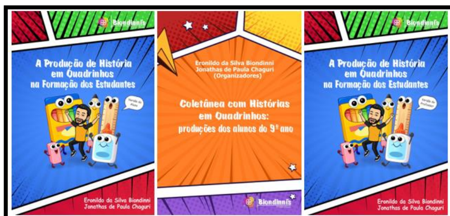
Figura 3 – Produtos sociais como resultado da intervenção didático-pedagógica