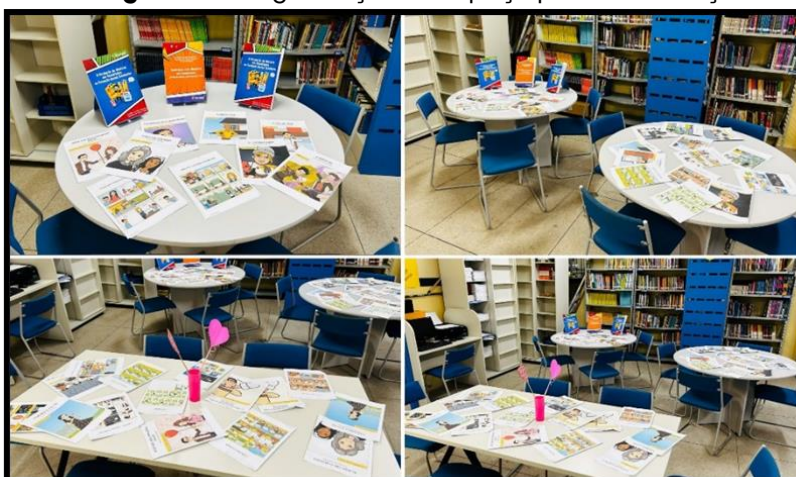
Fotografia 4 - Organização do Espaço para Socialização