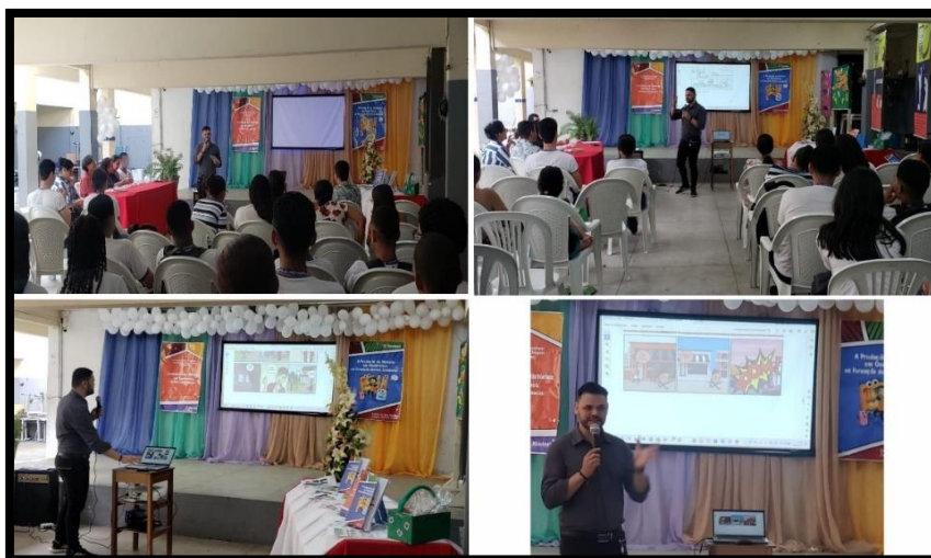
Fotografia 3 – Exposição do Professor