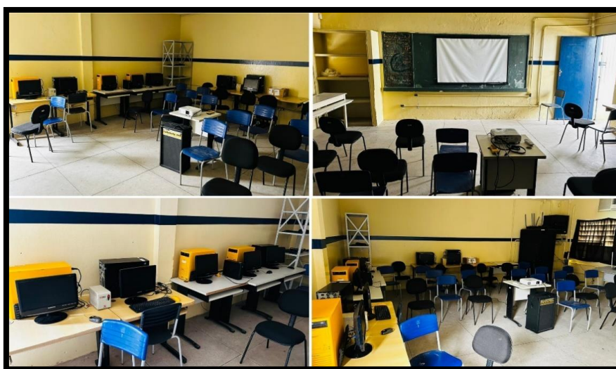
Fotografia 1 - Laboratório de Informática

Atualmente, o espaço conta com os seguintes equipamentos: 06 (seis) equipamentos conectados à rede mundial de computadores; 01(uma) caixa de som amplificada; (um) projetor multimídia; (uma) tela para projeção; (uma) estante em aço; 01 (um) quadro de giz de fundo escuro; 01 (uma) porta de entrada e saída; 12 (doze) lâmpadas fluorescentes; 01 (um) roteador wi-fi de alto desempenho; 07 (sete) mesas para computadores; 01 (uma) bancada e 28 (vinte e oito) cadeiras. Cabe ressaltar que o servidor de informática da escola encontra-se alocado neste espaço. A Foto 1 exibe a infraestrutura do atual laboratório de informática, devido ao trabalho realizado com o processo interventivo da pesquisa.