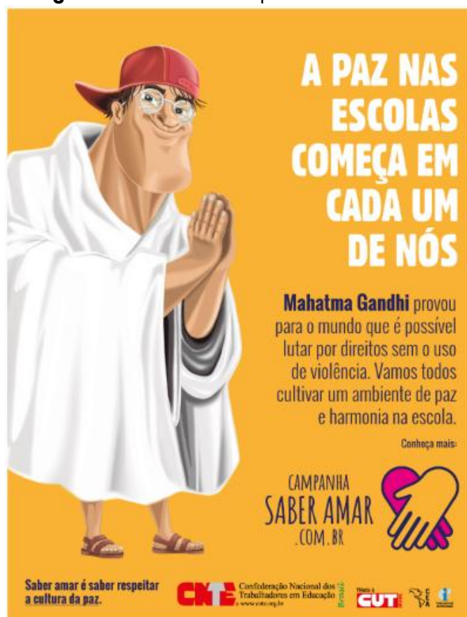
Figura 1: Cartaz de Campanha Comunitária