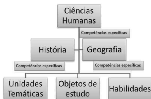
Figura 2: Organograma BNCC História Ensino Fundamental

O documento final apresenta as competências específicas da área, as competências específicas de História e Geografia, as unidades temáticas, os objetos de conhecimentos e as habilidades de cada componente curricular a serem desenvolvidas em cada uma das etapas/anos do Ensino Fundamental.