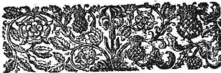
Figura 2: Gravura da página 1.