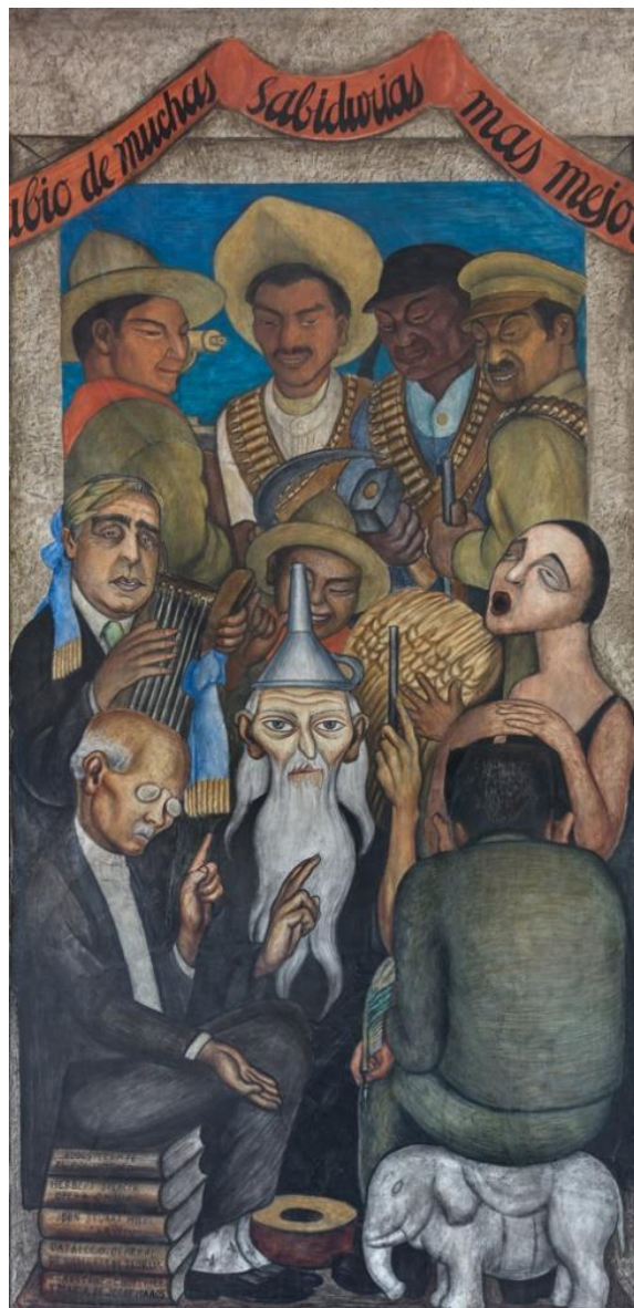
Figura 6 - RIVERA, Diego. Los sabios. 1928. Fresco. 4.41 x 1.55 m.

Vasconcelos também teve uma relação conturbada com David Siqueiros, cuja lentidão do trabalho alega ter relevado por anos (Vasconcelos, 2007: 262). Mas, sua boa têmpera parece não ter resistido à fundação do Sindicato de Obreros, Técnicos, Pintores y Escultores (SOTPE) em dezembro de 1923 – o qual tinha Siqueiros como diretor. Quanto à arte, o ministro diz ter uma posição contrária à criação de sindicatos: