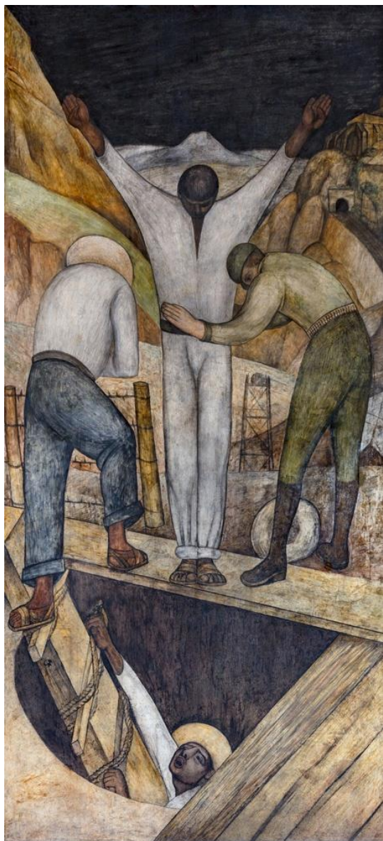
Figura 5 - RIVERA, Diego. Salida de la mina . 1923. Fresco. 4.78 x 2.15 m.