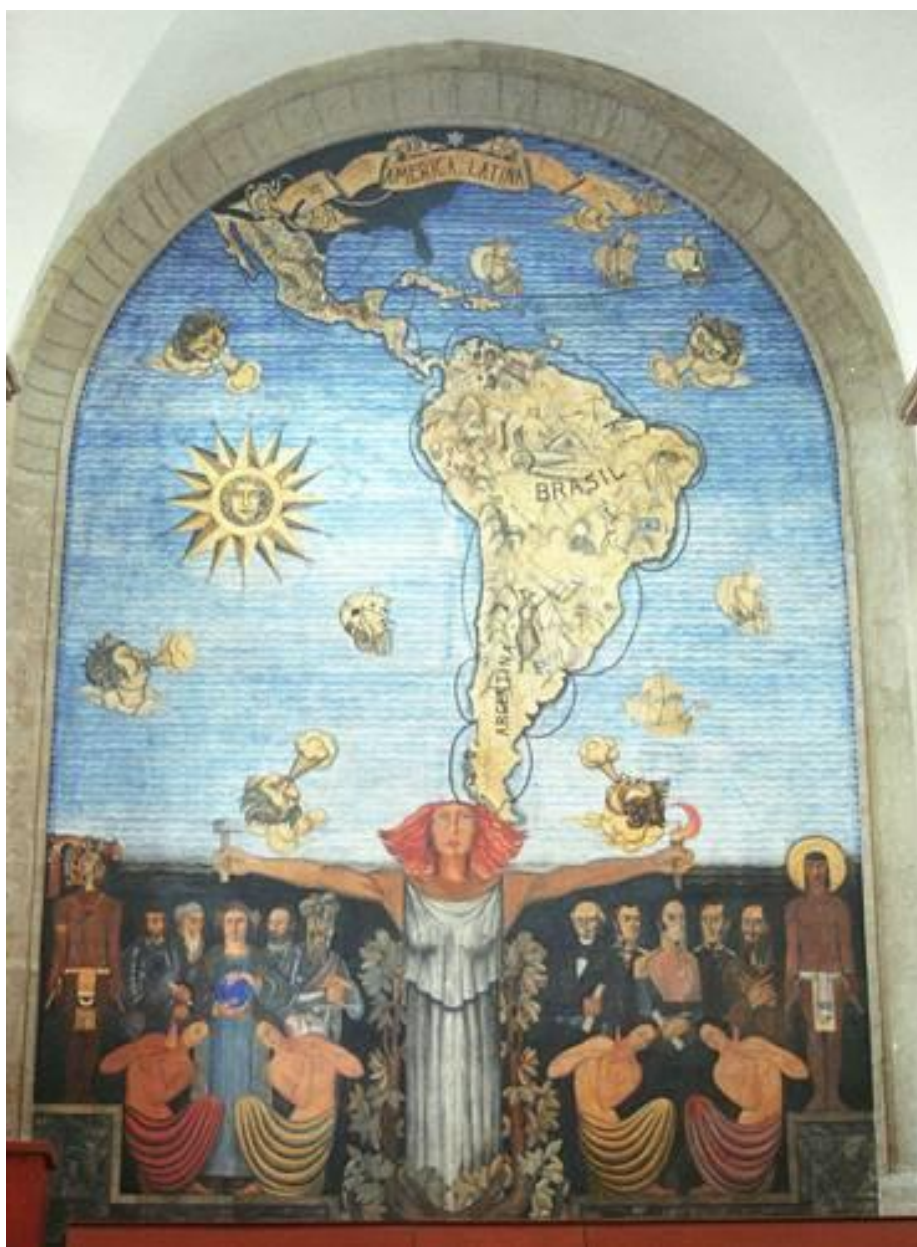
Figura 4 - MONTENEGRO, Roberto. La unión de América Latina. 1924. Fresco. 15.00 x 9.19 m.