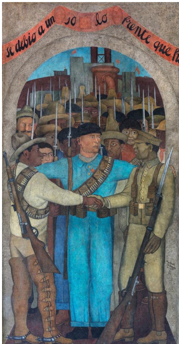
Figura 3 - RIVERA, Diego. Un solo frente. 1928. Fresco. 4.41 x 1.62 m.

Roberto Montenegro, também comissionado por Vasconcelos, pintou a união das raças na América Latina no mural principal do Salón Hispanoamericano da SEP (Figura 4). O mural apresenta a América Latina personificada como uma mulher de tez ocre e cabelos vermelhos que brota, de braços abertos, segurando um martelo e uma tocha – cuja chama toma forma da lâmina de uma foice –, do meio de uma série de galhos para proteger várias figuras ibero-americanas. Ali estão Hernán Cortés, Américo Vespúcio, Cristóvão Colombo, Francisco Pizarro e Vasco Núñez de Balboa,