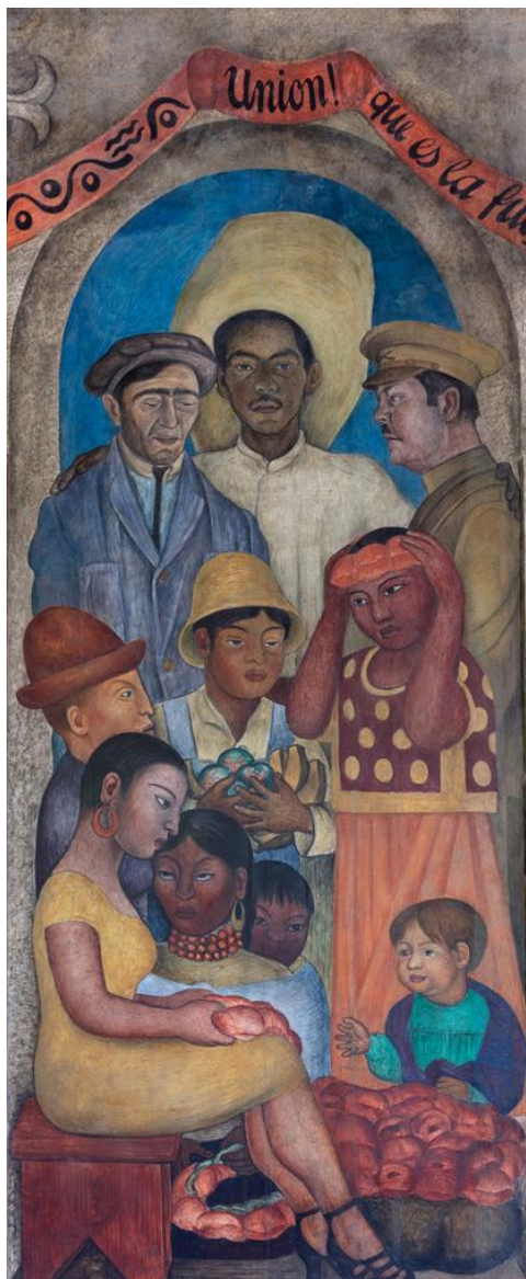
Figura 2 - RIVERA, Diego. La unión . 1928. Fresco. 4.42 x 1.30 m.