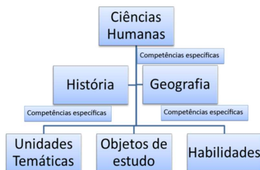
Figura 2: Organograma BNCC História Ensino Fundamental

O documento final apresenta as competências específicas da área, as competências específicas de História e Geografia, as unidades temáticas, os objetos de conhecimentos e as habilidades de cada componente curricular a serem desenvolvidas em cada uma das etapas/anos do Ensino Fundamental.