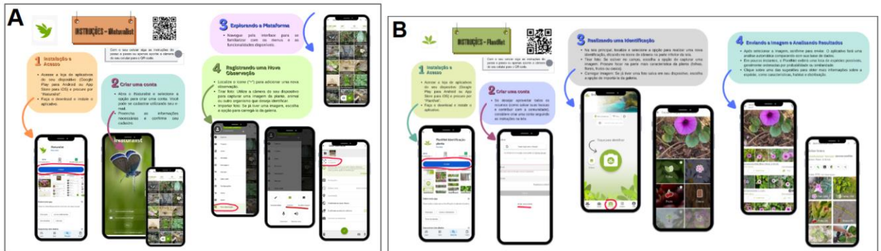
Figura 1: A) Guia de uso do aplicativo iNaturalist; B) Guia de uso do aplicativo PlantNet.

Os universitários também elaboraram guias explicativos sobre como usar os aplicativos iNaturalist (Figura 1A) e PlantNet (Figura 1B), auxiliando os estudantes na identificação das espécies registradas em fotografias. Além disso, produziram uma folha de registro de espécies, um questionário simples de avaliação do projeto e certificado de menção honrosa que fez parte da premiação do projeto.