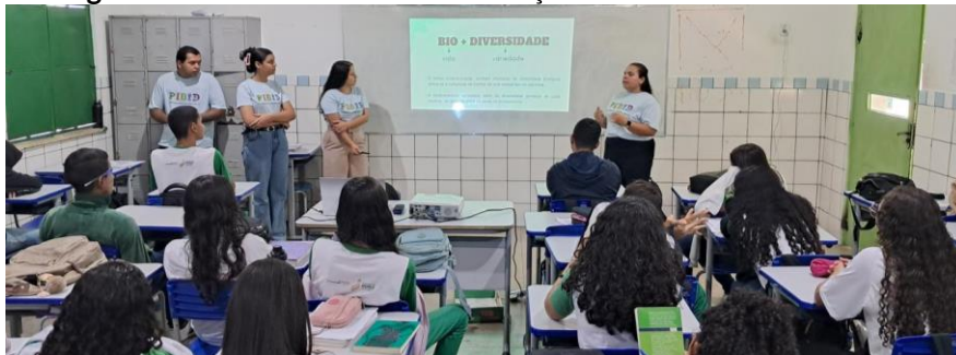
Figura 2: PIBidianos durante a realização de uma das aulas teóricas.

Na primeira intervenção com os estudantes, foram apresentados os slides, com os objetivos e fases do projeto, bem como foi promovido um diálogo sobre a diversidade biológica local, sua relevância e a relação entre fotografia e ciência, destacando como essa prática pode contribuir para a documentação e preservação das espécies nativas. Durante a aula, também foram destacadas as estratégias de observação, registro e conceitos básicos de fotografia (Figura 2).