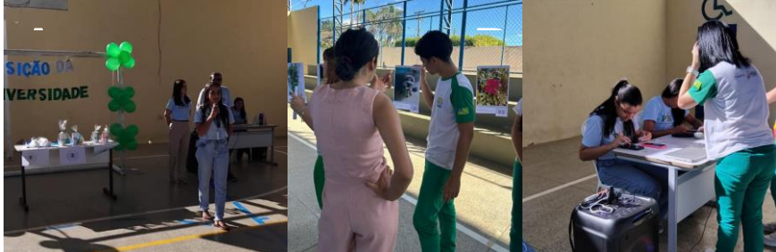
Figura 3: Registros do dia da exposição: (A) Fala dos pibidianos sobre o projeto Vidas Invisíveis; (B) Apresentação das fotografias pelos alunos; (C) Votação das fotos mais impactantes pelos visitantes.