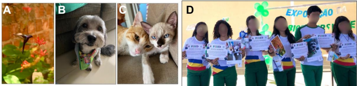
Figura 5: Fotos vencedoras: A) 1º lugar; B) 2º lugar; C) 3º lugar; D) Duplas ganhadoras.

Apesar da diversidade de critérios que influenciaram a votação, as três fotos mais votadas (Figura 5A, 5B, 5C e 5D) se destacaram por apresentarem animais, principalmente, domésticos. Evidenciando o interesse dos votantes pela fauna ou revelando uma visão limitada da biodiversidade, deixando de contemplar a importância de outros elementos que são igualmente importantes, como as plantas, paisagens ou interações ecológicas. Corroborando o estudo de Bortolozzo (2022), que destaca, que a interpretação de fotos da natureza estão sempre sujeitas às subjetividades, como estética e popularidade, e a contextos culturais dos observadores.