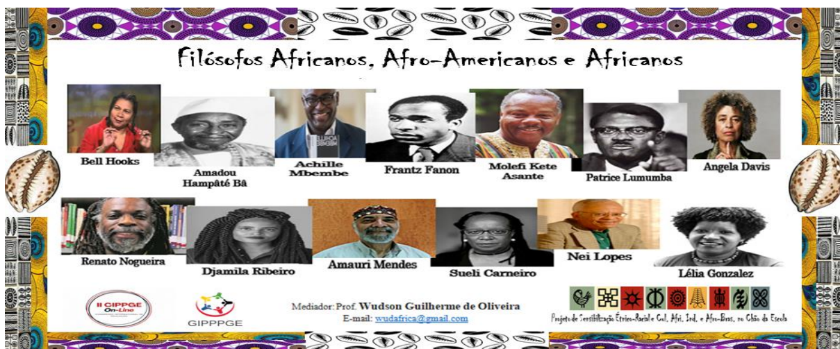
Imagem 4 – Slide com alguns intelectuais africanos, afro-americanos e afro-brasileiros