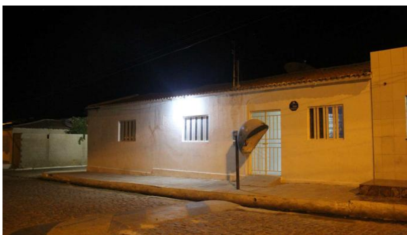
Figura 4 - Fachada da Escola Municipal Maria Monteiro Bacelar

A Escola Municipal Maria Monteiro Bacelar está localizada no coração do Rodeadouro, bem no centro da comunidade, na sua rua principal que traz em seu nome a homenagem ao seu santo padroeiro, São José. O prédio está ao lado da Igreja e em frente às águas do Velho Chico, conforme por ser verificada pela figura 4, realizada à noite, ao fim dos primeiros dias do trabalho de campo para a elaboração da dissertação.