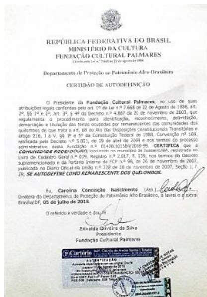
Figura 3 - Certidão de Autodefinição

pode ser verificada na Figura 3. Até a presente data ainda não havia sido expedida a titulação, ou seja, o processo de reconhecimento não está concluído.