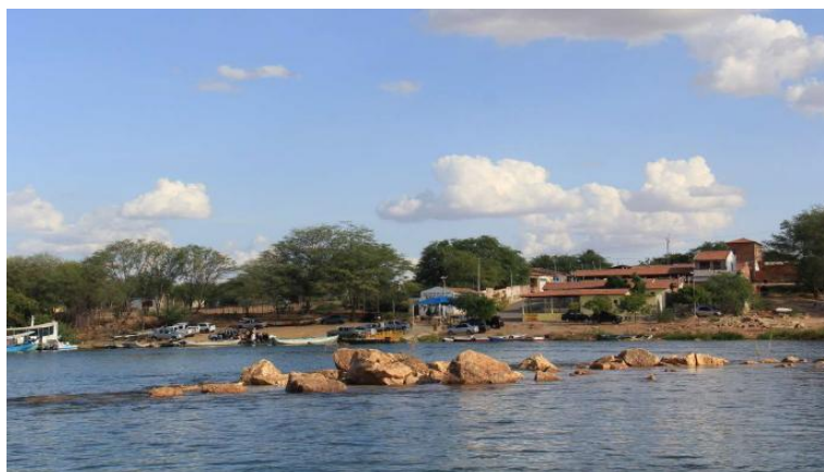
Figura 2 – Vista do Rodeadouro a partir do Rio

A figura 2 apresenta a fotografia das rochas citadas na história sobre a escolha do nome da comunidade. A imagem fora registrada de dentro de uma das embarcações que faz o transporte entre o Rodeadouro e sua a Ilha homônima.