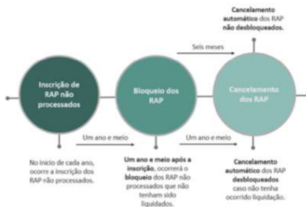
Figura 01: Sistemática do RPNP pelo Decreto nº 9.428/2018.