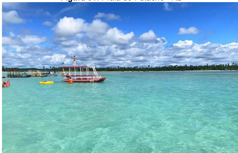
Figura 01: Praia do Patacho - AL

O estudo foi aplicado na Praia do Patacho (Figura 01), situada na Rota Ecológica dos Milagres, destacada pela SEDETUR/AL como um dos principais destinos turísticos de Alagoas.