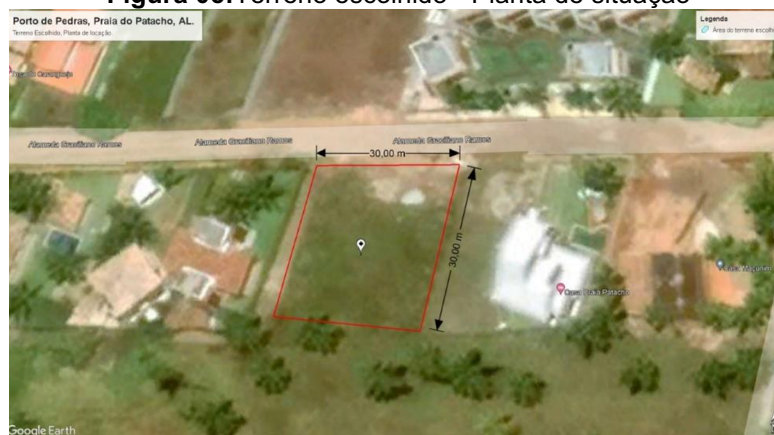
Figura 05: Terreno escolhido - Planta de situação