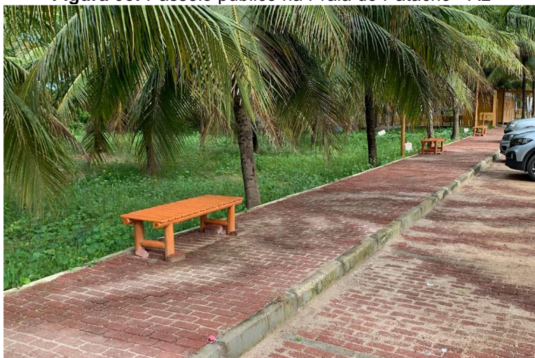
Figura 03: Passeio público na Praia do Patacho - AL