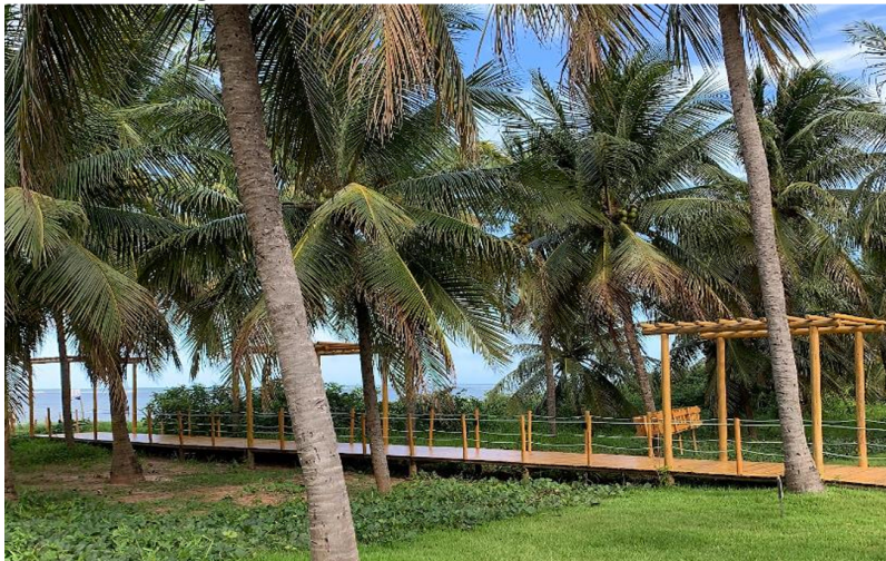
Figura 02: Acesso à Praia do Patacho -AL