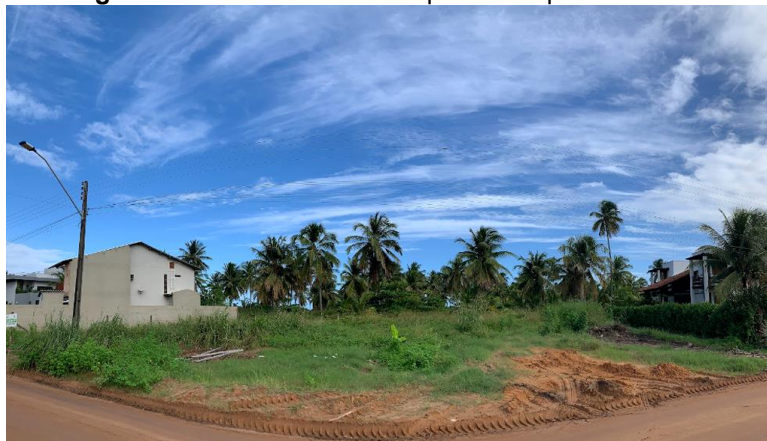
Figura 04: Terreno escolhido para o empreendimento